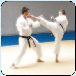
A. C. – TALIANSKO

Zastavil som teda svojich kamarátov v telocvični, ktorí sa už chystali zasiahnúť a išiel som sa s tými chalami porozprávať. Povedal som im, že nemá žiaden zmysel ukradnúť trofeje, pretože je potrebné rešpektovať úsilie a obety toho, kto si víťazný pohár naozaj zaslúžil.