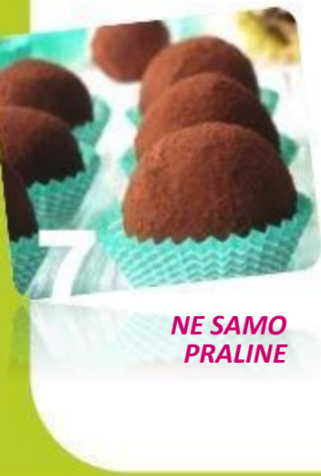
NE SAMO PRALINE

P re nekog vremena smo saznali da je jedno područje Pakistana doživelo veliku poplavu.